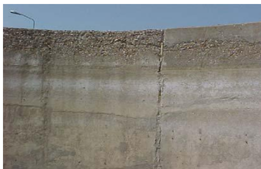
شکل ۱: نمونه ای از خوردگی بتن در اثر تهاجم اسیدی

در رابطه دوم مشاهده می‌شود که سولفوآلومینات (اترینگایت) تشکیل می‌شود که بلوری شدن آن منجر به انبساط و تخریب بتن می‌شود. اگر بتن مسلح در محیط‌های اسیدی قرار گیرد خوردگی در آرماتور ایجاد خواهد شد. در صورتی که حمله کلر و سولفات‌ها توأم باشد فرآیند خوردگی تشدید خواهد شد. البته لازم به ذکر است که هنوز در این زمینه تحقیقات لازم و کافی صورت نگرفته است. در صورت تهاجم سایر اسیدها می‌توان گفت که مکانیزم تهاجم بستگی به نوع اسید دارد و در حالت کلی می‌توان مکانیزم را در دو فاز مطرح نمود، فاز اول تشکیل نمک کلسیم و فاز دوم تهاجم اسید به ژل سیمان. البته فاز دوم زمانی صورت می‌گیرد که تمام هیدروکسید کلسیم در فاز اول مصرف شده باشد. اگر نمک کلسیم محلول باشد در فاز ملات جایجا شده و فاز ملات سست خواهد شد. ۳